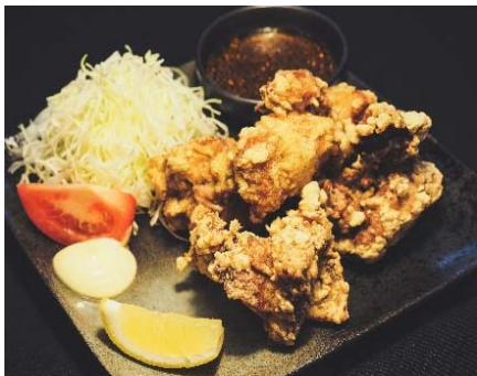
Fried Chicken with Mentaiko Sauce