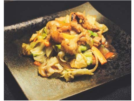
Sautéed Beef Intestine and Cabbage