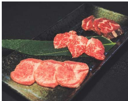
Yakiniku US Beef (Last Order 1 PM)