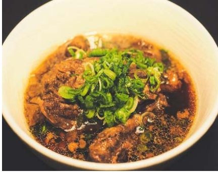
Beef Kalbi Stew