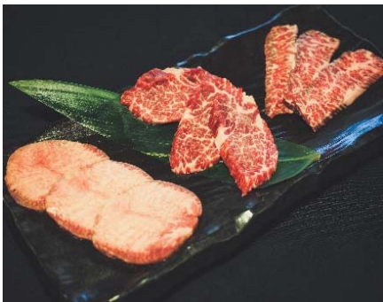
Yakiniku Washugyu (Last Order 1 PM)