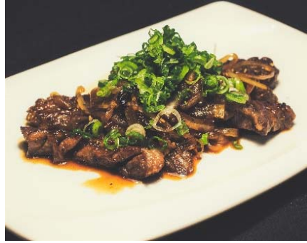
Rib Finger BBQ