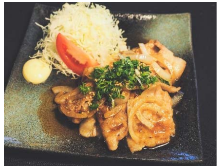
Mugifuji Pork Ginger